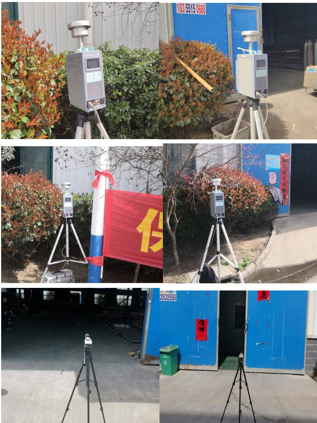
现场监测取样照片