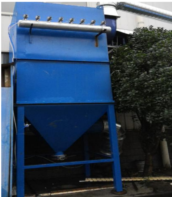
激光切割机配套布袋除尘器