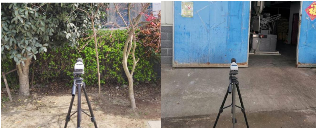
现场监测取样照片