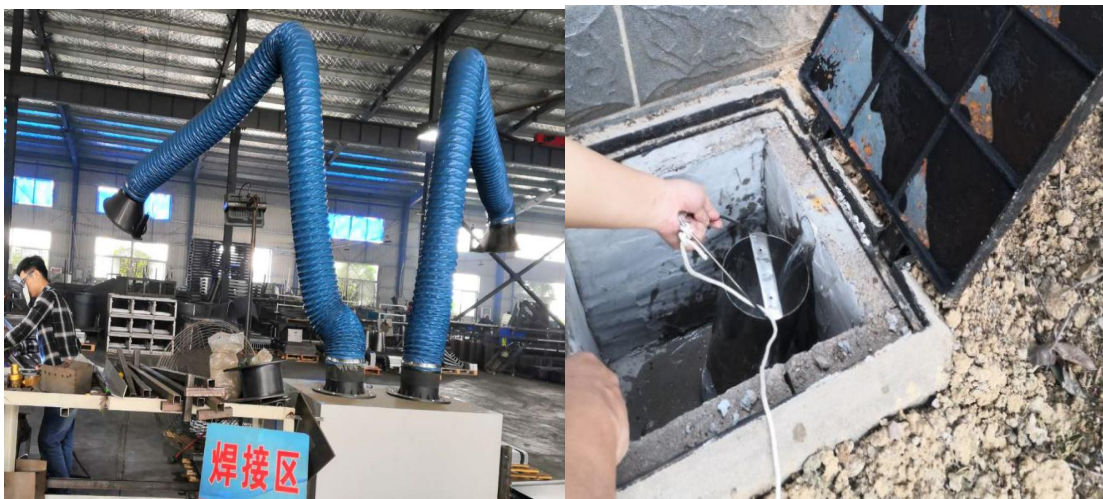
移动式焊接烟尘净化器