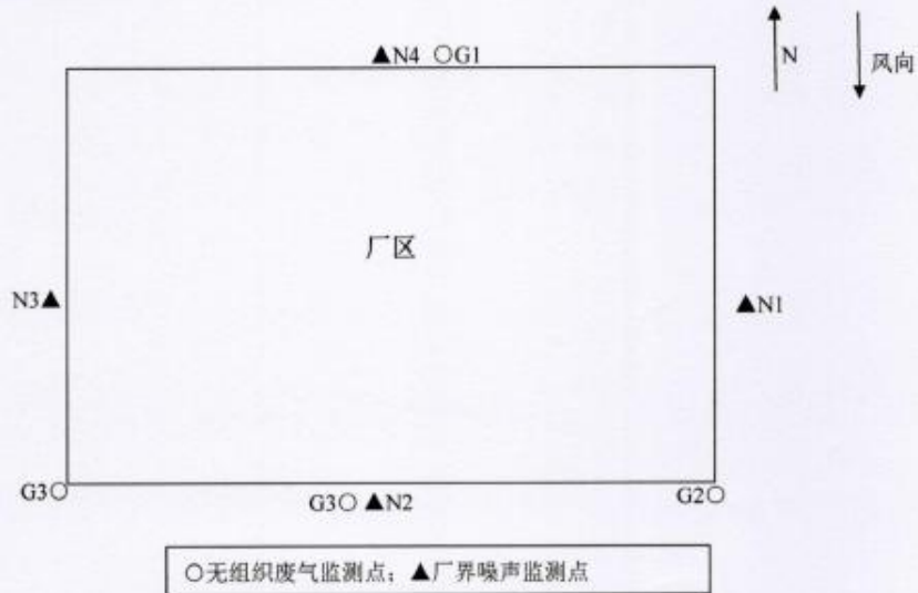
图 7-1 检测点位示意图